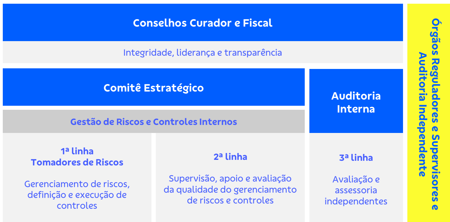
Figura 5 - Modelo Referencial das 3 Linhas da Fundação BB

A Fundação BB adotou o direcionador COSO ( The Comitê of Sponsoring Organizations ou Comitê das Organizações Patrocinadoras) para o desenvolvimento e a implementação do seu Sistema de Controles Internos, e estabeleceu o Modelo Referencial das 3 Linhas para a avaliação da efetividade desse Sistema, conforme demonstrado na figura a seguir: