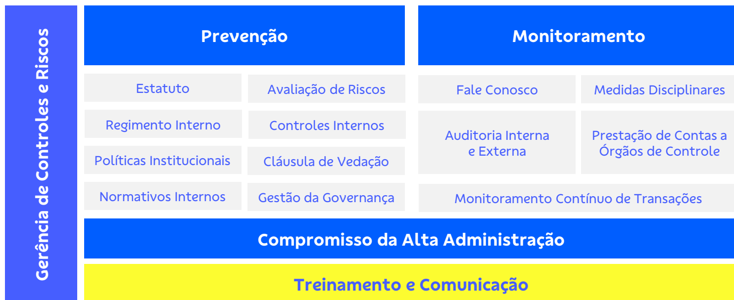
Figura 7 - Estrutura de Monitoramento do Programa Integridade

O quadro a seguir demonstra a estrutura de monitoramento do Programa de Compliance e Integridade: