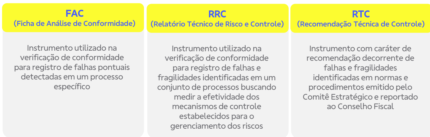
Figura 6 - Instrumentos de Controles Internos da Fundação BB

Além dos mecanismos citados acima, são instrumentos de Controles Internos na Fundação BB: